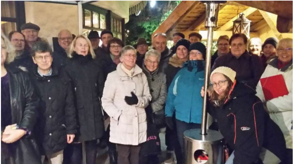
Texte und Fotos: Karl Echle

Mit weihnachtlichen Gesängen erfreut der Taborchor zum wiederholten Mal die Gäste des Hotel Bareiss in Baiersbronn. Am Sonntag, 5. Januar 2020, 16.00 Uhr haben wir unseren Auftritt auf der stimmungsvoll dekorierten Terrasse, Pastoralassistentin Susanne Tepel wird mit weihnachtlich-besinnlichen Impulsen durch das Programm führen. Das Bild zeigt den Taborchor beim letztjährigen Auftritt im Hotel Bareiss.