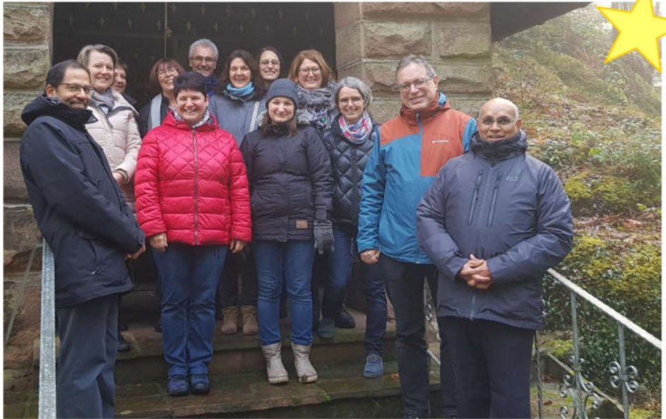
Die Mann- und Frauschaft aus dem Pfarramt wünscht frohe und gesegnete Weihnachtsfeiertage ... und einen guten Start ins Neue Jahr!!!